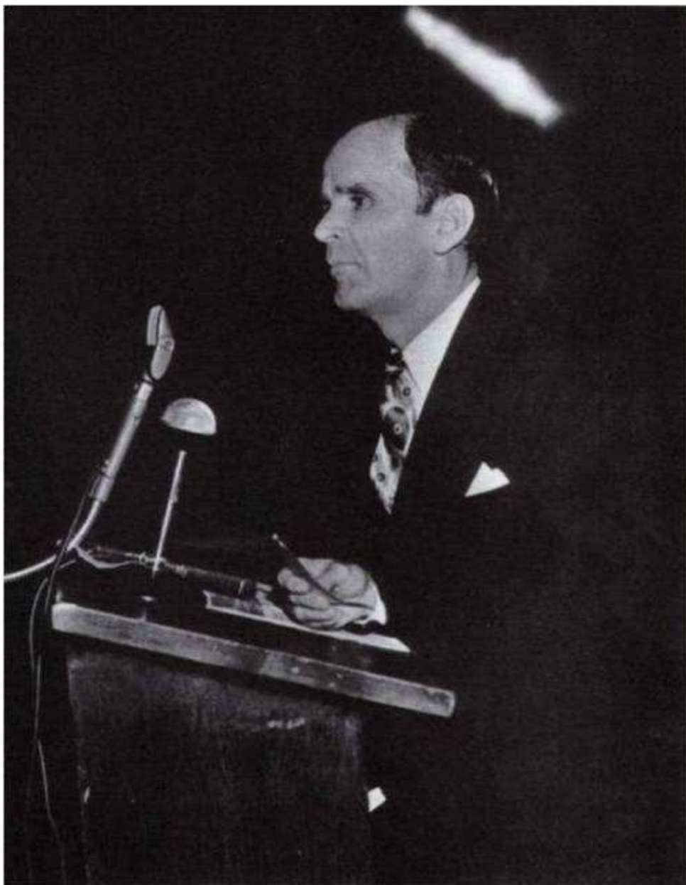
Vatreni stub iznad proroka