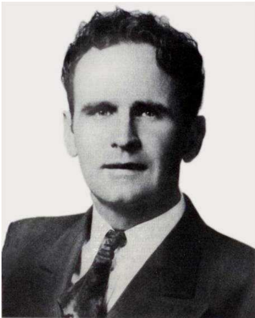
Brat Branham kao mladi propovednik

1933. godine, u njegovom životu su počeli da se dešavaju neverovatni događaji, koji bi zahtevali posebnu knjigu, da bi se u potpunosti opisali. Ali, kada je Brat Branham počeo da propoveda i gradi crkvu, Bog mu je davao vizije, i ja, zaista, mogu da kažem da je Bog počeo da se otkriva, zato što je Božija Reč dolazila posredstvom „otvorene vizije“. Na taj način je, posle mnogo vekova, Bog ponovo posetio ljude ovog pokolenja, preko proroka. On je poslao proroka, izabranog od utrobe majke, određivši život tog čoveka od samog detinjstva, oblikujući ga, kao što je On to činio sa drugim Božim ljudima u Svetom pismu.