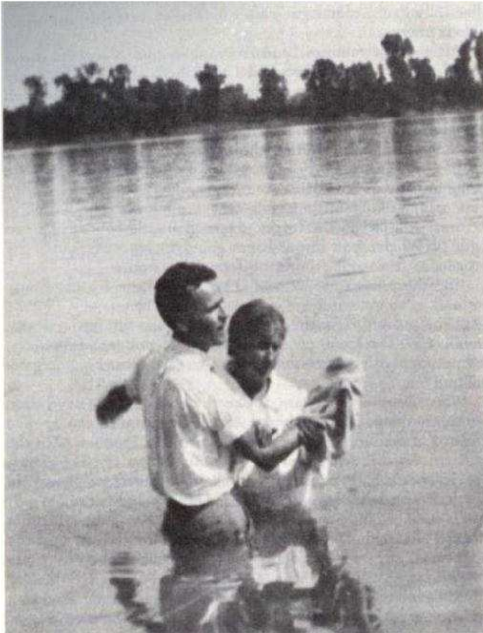
Mladi propovednik krštava na reci Ohio

dogodilo Pavlu na putu za Damask. Glas je rekao: „Kao što je Jovan Krstitelj bio poslat da objavi prvi dolazak Gospoda Isusa Hrista, tako si iti poslan da objaviš Njegov drugi dolazak.